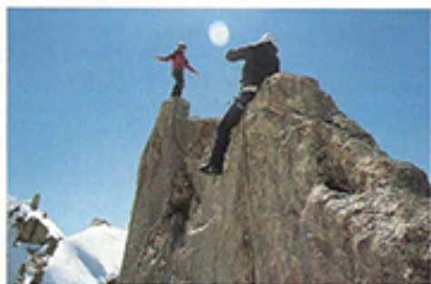
Buscando lugares remotos, Cecilia Buil, Itaki Cabo, Elena de Castro y Ferran Latorre abrieron y filmaron para Al filo... No se sabe si es más inhóspito el país o sus montañas.