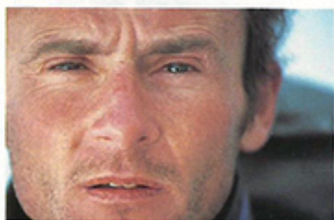
El resumen de Alberto Iñurategi después de ver a Lafaille moverse en la Arista Este del Annapurna: "¡Otro nivel!...". El de quien ha hecho 8c, M10 en seco y 7 en hielo, A5 y funciona en altura.